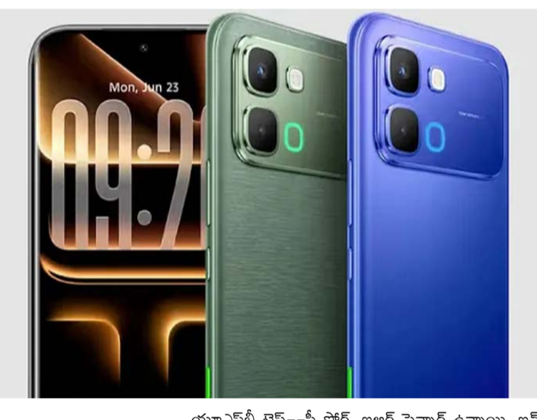
రెసిస్టెన్స్ నిర్దిష్టకెట్, ఆండ్రాయిడ్ 16 ఆధారిత ఎక్స్ఓఎస్ 16 ఆపరేటింగ్ సిస్టం తదితర ఫీచర్లు ఉన్నాయి. వెనకవైపు 50 మెగా పిక్సెల్ మెయిన్ కెమెరాతో పాటు 8 మెగా పిక్సెల్ అల్ట్రా వైడ్ లెన్స్తో కూడిన ద్వయంలో కెమెరా సెట్ అప్ ఉంది. ముందువైపు సెల్ఫీలు, వీడియో కాల్స్ కోసం 13 మెగా పిక్సెల్ సెల్ఫీ కెమెరా ఇచ్చారు. 6500 ఎంపిహెచ్ బ్యాటరీ ఉంది. 45డబ్ల్యూ ఫ్లాస్ట్ ఛార్జింగ్ సదుపాయంతో వస్తోంది. యూఎస్బీ టైప్--సీ పోర్ట్, బలత్ సెన్సార్ ఉన్నాయి. ఇన్--డిస్ప్లే ఫింగర్ ప్రింట్ సెన్సార్లున్నాయి.

చైనా మొబైల్ తయారీ సంస్థ ఇన్ఫినీక్స్ బడ్జెట్ ధరల్లో కొత్త స్మార్ట్ ఫోన్ తీసుకువచ్చింది. 'ఇన్ఫినీక్స్ నోట్ ఎడ్జ్ 5జీ' పేరుతో భారత మార్కెట్లో విడుదల చేసింది. 6 జీబీ ర్యామ్, 128 జీబీ ఇంటర్నల్ స్టోరేజీ వేరియంట్ ధర రూ. 21,999గా, 8 జీబీ ర్యామ్, 128 జీబీ ఇంటర్నల్ స్టోరేజీ వేరియంట్ ధర రూ. 23,999గా, 8 జీబీ ర్యామ్, 256 జీబీ ఇంటర్నల్ స్టోరేజీ వేరియంట్ ధర రూ. 25,999గా నిర్ణయించారు. లాంట్ ఆఫ్టర్ భాగంగా 12 నెలల సాధారణ వారెంటీతో పాటు 12 నెలల ఎక్స్టెండ్డ్ వారెంటీ సదుపాయాన్ని కంపెనీ కల్పిస్తోంది. వన్టైమ్ స్క్రీన్ రిఫ్రెష్మెంట్ ఆఫర్ను కూడా అందిస్తోంది. ఎస్బీఐ, ఐసీఐఐఐ బ్యాంకు కార్డుల ద్వారా చేసే కొనుగోళ్లపై రూ.2 వేల వరకు అదనపు డిస్కౌంట్ లభిస్తుంది. ఫ్లిప్కార్ట్లో పాటు కంపెనీ వెబ్సైట్, ఆఫ్ లైన్ స్టోర్లలో ఈ ఫిబ్రవరి 25నుంచి సేల్ అందుబాటులో ఉండనుంది. సిల్వీ ఫైబర్ ఫినిష్, స్పెల్డర్ బ్లూ, లూనార్ బ్రెజిలియం కలర్లలో మూడు వేరియంట్లలో లభిస్తుంది. ఇందులో 6.78 అంగుళాల 1.5కే ట్రీడ్ కర్వెడ్ అమోలెడ్ డిస్ప్లే, కార్టింగ్ గౌరెజ్ గ్లాస్ 7వ ప్రాటెక్షన్, మీడియాటెక్ డ్రెమస్పిటి 7100 ప్రాసెసర్, ఐపీ65 వాటర్ అండ్ డస్ట్